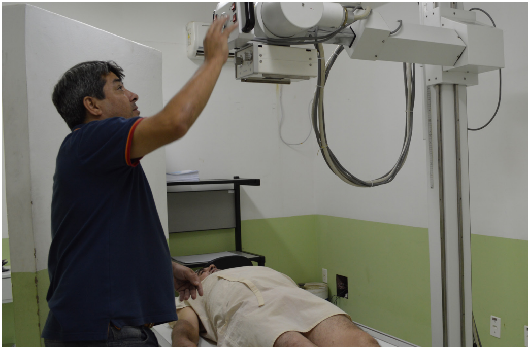
Em novo espaço, na sede do Consórcio, equipamento de raios-X atende pacientes com mais conforto

recer serviços de saúde de qualidade, humano e eficaz, o Consórcio é o exemplo acabado de que a parceria desprendida de entes públicos resulta em avanços coletivos que culminam no bem-estar social e em uma sociedade mais justa e igualitária.